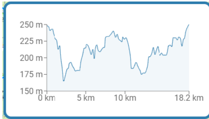
Höjdkurva blå slinga

OBS! När ni rider ut på andra varvet på slingan rider ni INTE pliktport utan följer bara grusvägen i högervarv tillbaka till hinkplatsen 4.